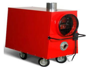
HP30 – HP250